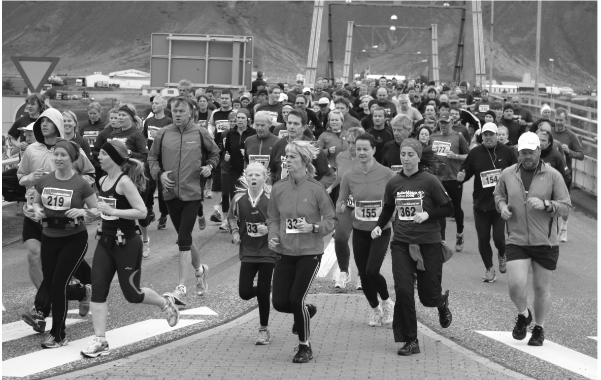
Formannspistill fluttur á aðalfundi frjálsíþróttadeildar 21. mars 2010