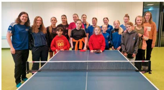
Frá stelpufjöri í Stekkjaskóla, æfingu sem var eingöngu fyrir konur og stelpur frá Suðurlandi og af höfuðborgarsvæðinu.

Iðkendur deildarinnar hafa tekið þátt í ýmsum mótum bæði á svæðis- og landsvísu. Á Íslandsmótinu á Hvolsvelli tóku nokkrir af iðkendum okkar þátt og komust á verðlaunapall. Við höldum einnig áfram að halda jólamótin okkar fyrir byrjendur og lengra