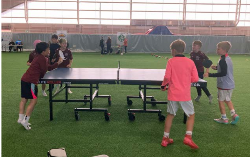
Krakkar að prófa borðtennis á frístundamessu í Selfosshöllinni.