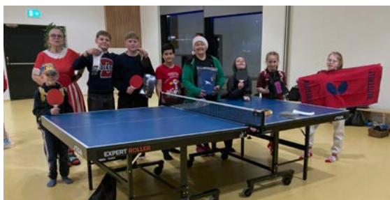
Frá jólamóti byrjenda sem haldið var í Stekkjaskóla.