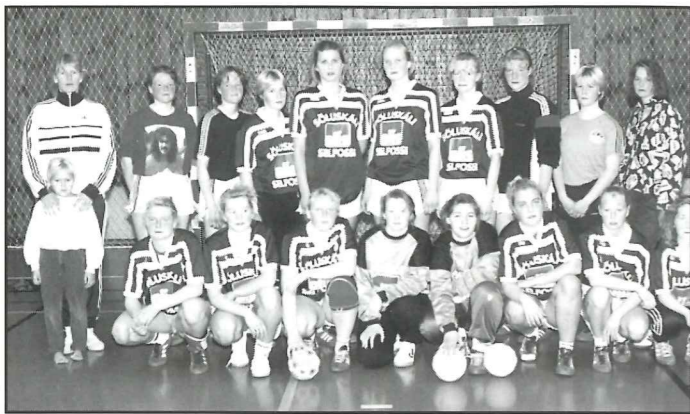
Hvar eru þær nú?