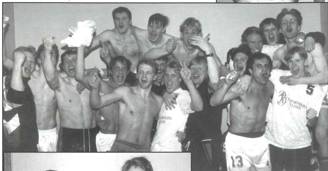
Eftir sigur eða hvað?