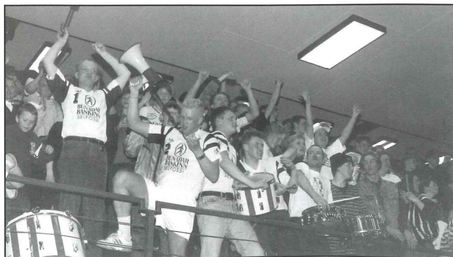
Þá var gaman.