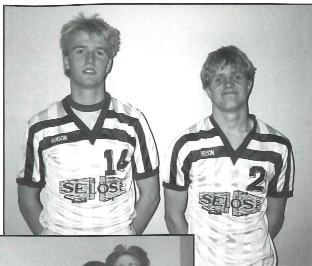
Ungir og efnilegir.