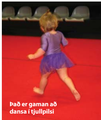
Það er gaman að dansa í tjullpíli

Það fer ekki milli mála að þeim finnst ótrúlega gaman og fæst vilja þau fara þegar tímanum lýkur. Það er börnum ómetanlegt að fá að efla hreyfiproska sinn á þennan hátt og kynnast íþróttum í gegnum leik.