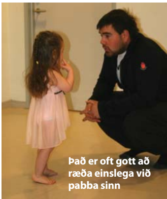
Það er oft gott að ræða einslega við pabba sinn