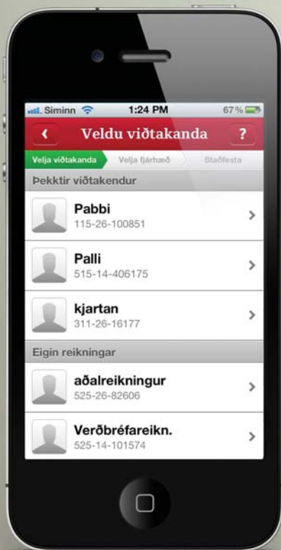
Veldu hraðfærslur á upphafsskjámynd og smelltu á þekkta viðtakanda