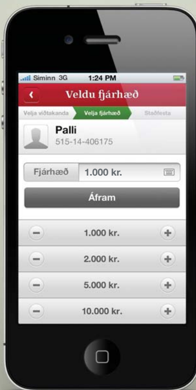
Veldu eða skráðu inn upphæð